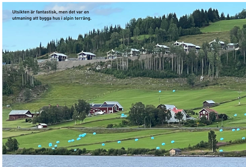
Utsikten är fantastisk, men det var en utmaning att bygga hus i alpin terräng.